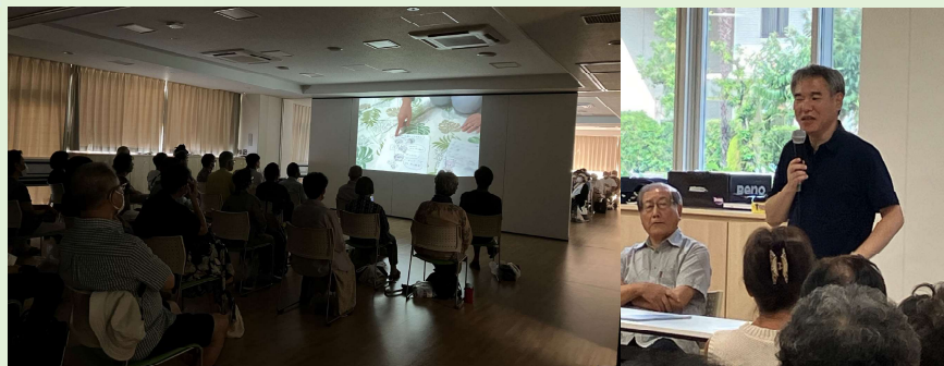
大きい会場を2つに分けて映画鑑賞